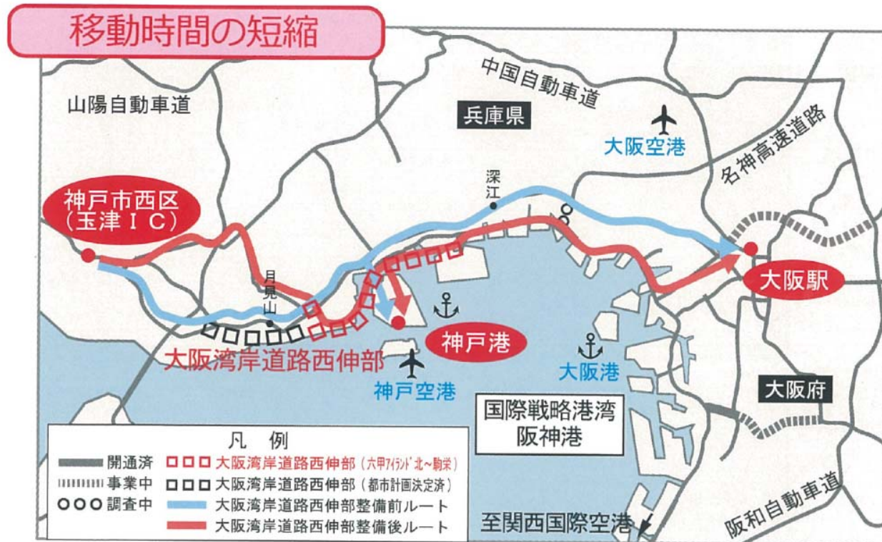
■神戸市西区（玉津 I C）～神戸港