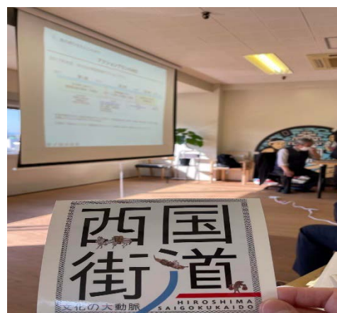
※まちなか西国街道推進協議会メンバーによる説明と西国街道ステッカー