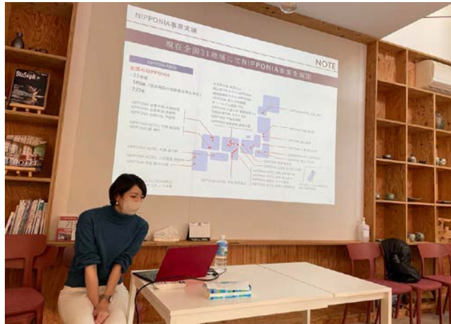
※NIPPONIA 担当者による説明