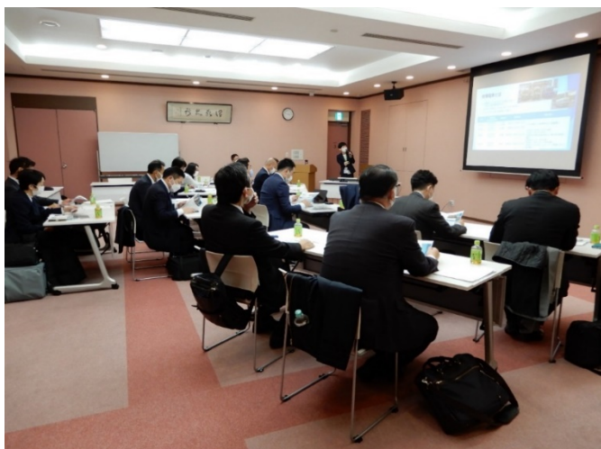
※広島電鉄本社にて取り組み事例を調査

神戸市においても、当該アプリの運用状況を見極めながら、今後の活用方法を検討していただきたい。