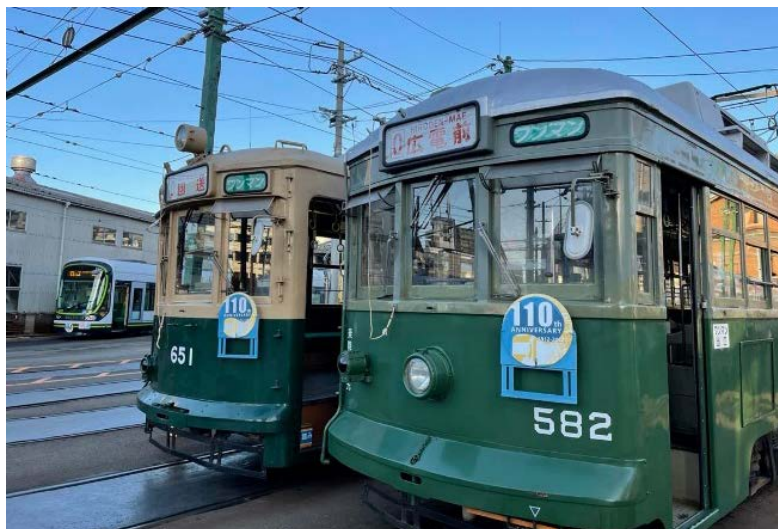
※神戸市交通局から広島電鉄へ移譲された神戸市電車両582号(右)

神戸市では、現在BRT(Bus Rapid Transit:連節バス)が走行し、LRT(Light Rail Transit:次世代路面電車システム)の検討も進んでおり、今後の議会での議論にも注目していきたい。