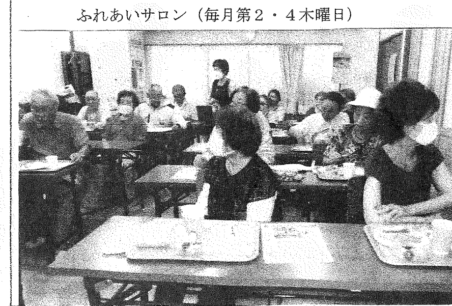
ふれあいサロン（毎月第2・4木曜日）