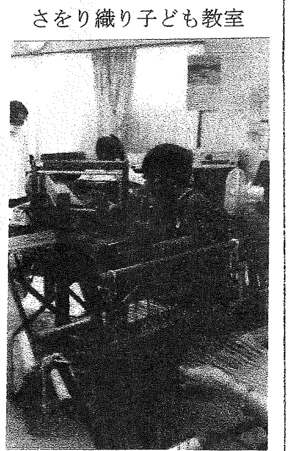
さをり織り子ども教室