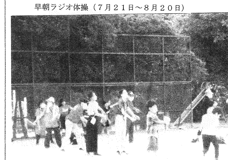
早朝ラジオ体操（7月21日～8月20日）