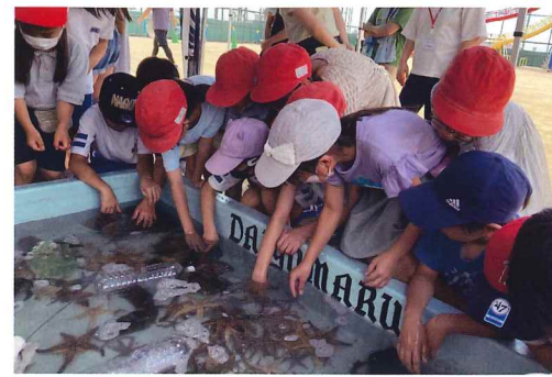
DAIYUMARUおさかなタッチ体験

地域の皆様、いつも美野丘小学校の子供たちを温かく見守っていただき、感謝しております。 今年度も地域の方々のご協力を得て、たくさんの行事を行うことができました。 子供たちも日頃体験できないイベントを楽しむことができ、笑顔いっぱいです。