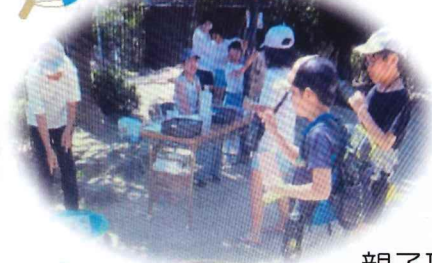
親子理科実験工作教室