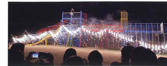
おやじの会 花火大会