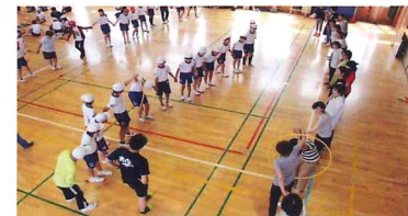
6年生 親子スポーツ大会