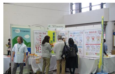
いきいきシニアライフフェア 2016