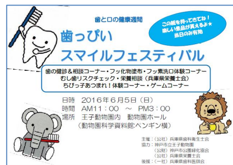
歯っぴいスマイルフェスティバルちらし