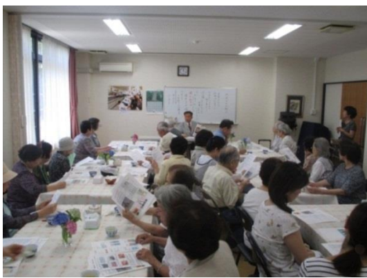
給食サービスでの口腔ケア出張講演会