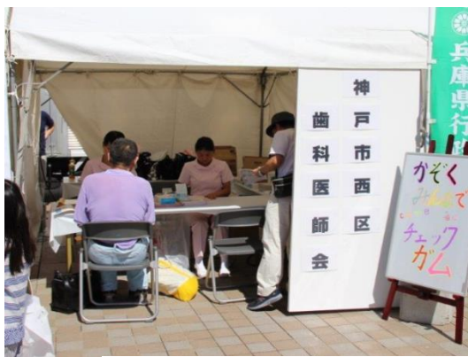
西区健康・福祉フェア

地域での交流を主な目的として、ひとりぐらしの高齢者を対象に、地域の自治会・婦人会・ボランティアが実施する「ふれあい給食会」に出向き、口腔ケアに関する講演会を行いました。区内11か所 450人