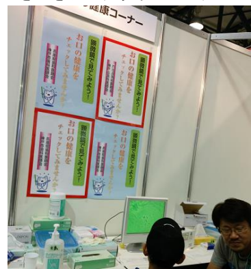
ひょうごKOB E医療健康フェア