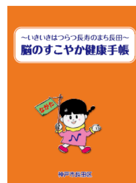
脳のすこやか手帳

熊本地震の支援における医療活動報告、区民の防災や発災時の備えに関する意識啓発に三師会・区・地域の関係者とともに取り組む予定です。