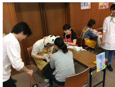
歯と口の健康ランド