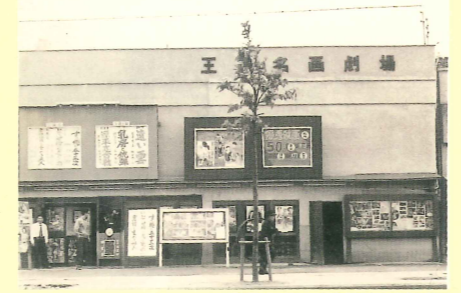
原田にあった王子名画劇場