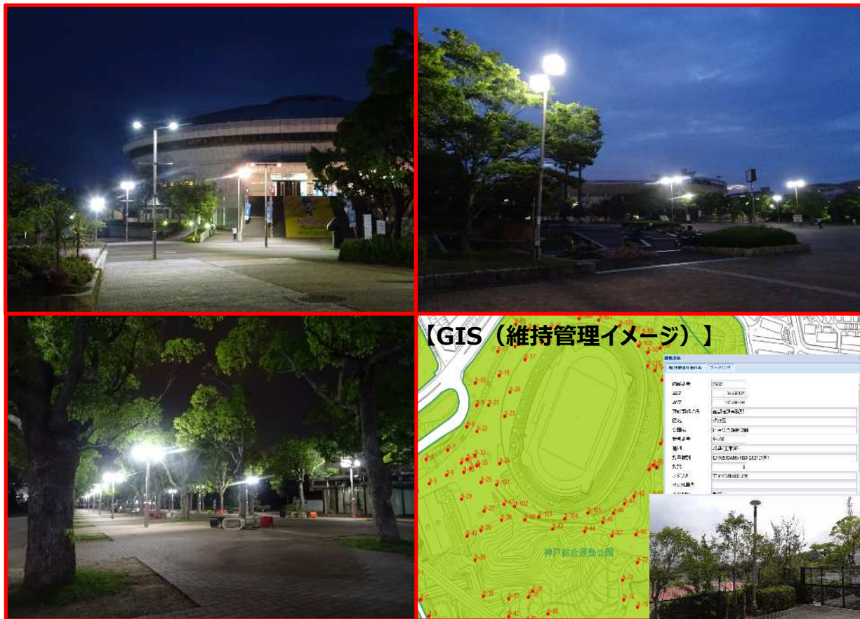
【対象公園灯の分布図】