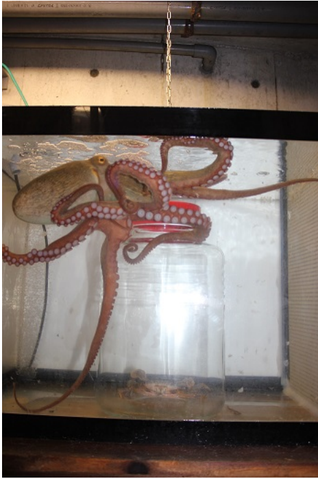
蓋開けに挑むマダコ

マダコの体は非常に柔軟で、体のサイズからは想像も付かないような、わずかな隙間をすりりと抜けてしまいます。今回のさかなライブでは、頭部の大きさの半分にも満たない細い透明のパイプの先に餌を用意し、餌を獲るためにパイプをすり抜ける様子をご覧ください。更には、マダコは学習能力が非常に高い一面を持ち合わせています。この学習能力をフルに使って、瓶の中に入っている餌を獲るため、蓋を開け、餌を取り出す様子もご覧いただけます。この二つの能力を2匹のマダコを使って、同時に観ていただきます。