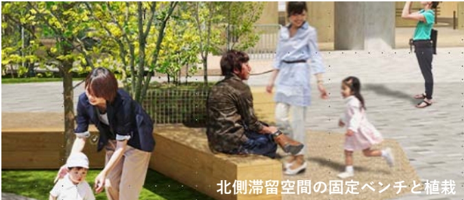
北側滞留空間の固定ベンチと植栽

↑1辺75cmのベンチと植栽のユニット。 ユニットはキャスター移動可能で組み合わせる。