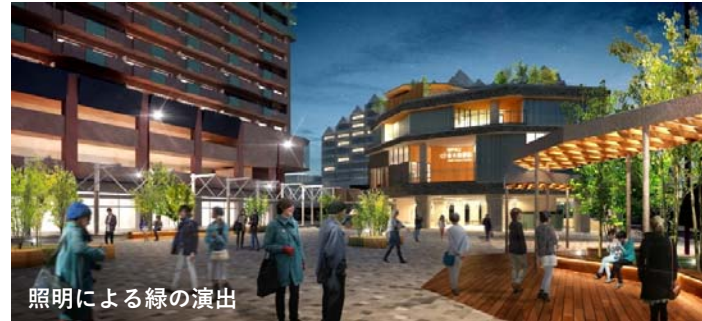
照明による緑の演出