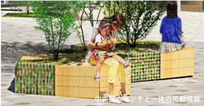
中央部のベンチと一体の可動植栽