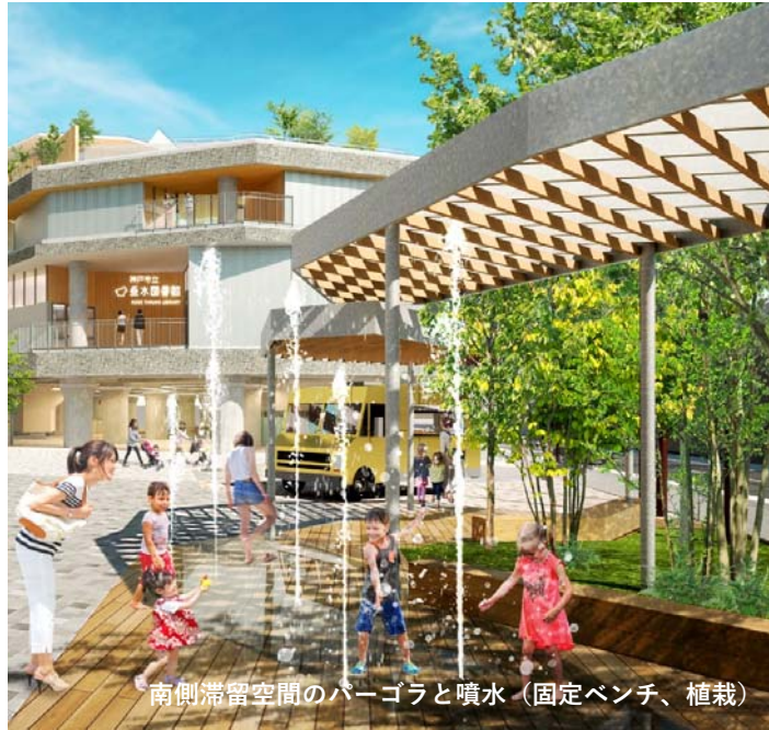
南側滞留空間のパーゴラと噴水（固定ベンチ、植栽）