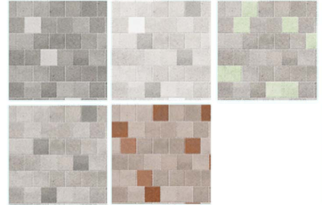
滞留空間インロク ブラウン系