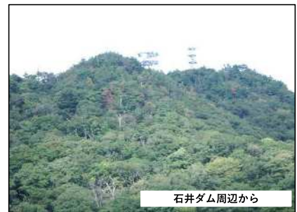
石井ダム周辺から