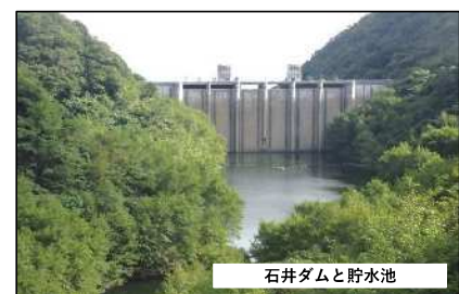
石井ダムと貯水池

森林における防災は、①石井ダムのような洪水調整を目的としたダムや、土砂崩れ時に流れた土砂を市街地まで流さない砂防ダム・砂防堰堤といった構造物による対策と、②間伐、樹林更新により樹林を適切に育成することで森林土壌の安定を図る森林整備による対策の両輪で成り立っています。