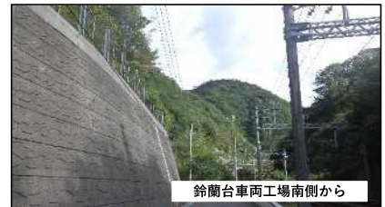
鈴蘭台車両工場南側から

神戸市では今年度、森林植生の多様性・眺望の確保、カラスザンショウ林の保全育成を図るため、菊水山の登山道・管理道沿いで常緑樹を中心とした森林整備を行う予定です。