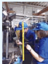
毎朝の光景、女性管理職による始業時の品質パトロール

これからも男女、年齢に関わらない雇用を行い、全従業員が活躍でき、いきいきと長く働き続けられる職場環境の維持向上に取り組んでいきます。