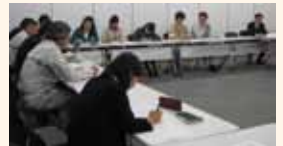
月に一度、支店内の間題点を話し合い、よりよい支社づくりを目指しています。

ハローパパ制度やライトダウンデーの実施等で男女共に家庭と仕事の両立をはかれるよう、働きやすい職場づくりに取り組んでいます。