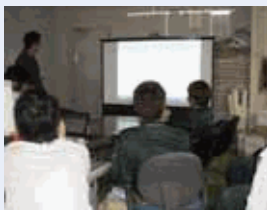
全工務職員で各現場の問題点や課題を出し合い共通理解を図ります。

すべての人が力を最大限発揮でき気持ちよく働ける職場づくりを目指しています。セクハラ、パワハラがないのは当たり前。ワーク・ライフ・バランスを実践して元気の職場環境を継続させます。