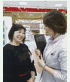
カンガールスタッフは、育児時間取得のビューティーコンサルタントをサポートしています。

資生堂の男女共同参画は、「男女を問わず、全社員が一人ひとりの能力・意欲を高め、それを最大限に引き出すことによって、組織を活性化し、会社の成長に寄与すること」を最終目標に2005年度よりスタートしました。