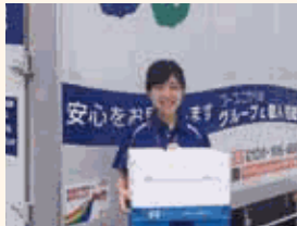
様々な現場で、女性も活躍しています。

性別、年齢、働き方等の異なる多様な職員が協力し、それぞれの力を最大限に発揮しあうことで、くらしの中の社会的課題を解決する事業体のトップランナーを目指しています。