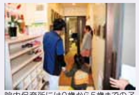
院内保育所には0歳から5歳までの子どもが通います。

・育休復帰後の研修や、男性の介護休暇取得など、職員の声を聞き、柔軟に対応しています。