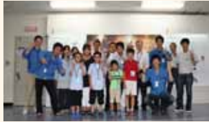
従業員の子どもが親の職場を見学する「子ども参観日」にて