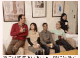
時には和気あいあい、時には熱く、研究者たちは議論や実験を日々重ねています!

研究の世界では、採用・評価・昇進において性別・年齢・国籍は関係ありません。仕事と家庭を両立し、その能力を十二分に発揮できるような職場環境の整備に取り組む事が重要と考えています。