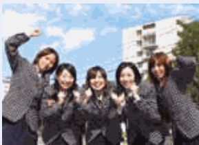
女性が輝ける職場づくりに取り組んでいます。

今後も、女性がやりがいと使命感をもって、いきいきと働ける職場環境づくりに邁進してまいります。