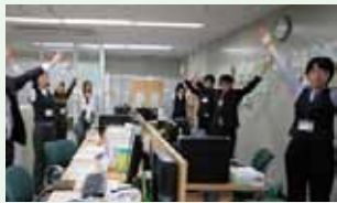
毎日、午前・午後の2回、社長以下全員で体操タイム。

男女の別なく社員を教育・登用する社風があり、働く人の心と体の健康を考え、これからもワーク・ライフ・バランスを支援する企業です。