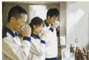
男女ともにいきいきと働ける職場です。

男女ともにいきいきと働ける職場です。社員の一人ひとりが日本の食文化の担い手として誇りを持ち、清酒白鶴を通じてやりがいを持って仕事に取り組んでいます。また、ワーク・ライフ・バランスへの取り組みも積極的に進めています。