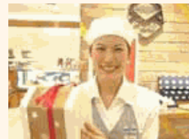
さんちかモロゾフグラン店

公正でオープンな人事制度を実施しており、採用・配置・昇進・教育訓練に男女差はありませんが、女性の活躍推進は企業戦略と考えて取り組んでいます。