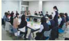
育児休職中の職員の不安を少しでも解消するために、年に1回、意見交換会を実施し、育児休職の職員をサポートしています。

制度や仕組みを備えているだけではなく、それらが現場でしっかりと運用されています。また、当組合には、職員一人ひとりに合ったキャリアビジョンを職員とJAが共に考え、創り上げる仕組みがあります。