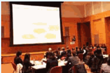
女性管理職候補層を対象とした「女性マネジメントセミナー」でのプレゼンの様子

当社社員のおよそ半分が女性であり、営業現場で活躍する女性社員や損害保険金を支払う部門でも示談交渉など責任のある仕事を任されている女性社員が多く、第一線で活躍しています。このような女性社員が、ライフイベントを迎えても、いきいきとやりがいを持って働き続けることができるよう勤務制度やキャリア形成支援プログラムの充実を図っています。