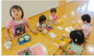
シフト勤務にあわせて早朝から開園する「ねすれっこ・はうす」では毎日元気な笑顔がみられます。

ネスレでは、社員一人ひとりが持つさまざまな違いを価値とし、さまざまな意見やアイデアを受け入れ尊重する「ダイバーシティ&インクルージョン」を今後も推進します。