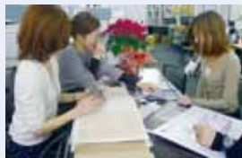
チームワークの良さは抜群

いきいきと健康的に共に働き、共にしあわせな未来を創りたいと思っています。結婚、出産、子育て、介護。共に働く仲間のためのサポートは惜しみません。