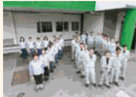
昨年創業70周年を迎えました。次は100周年です!

縁あって同じ目的を持つ仲間となった限りは、できるだけ長く一緒に働きたいと願っています。老若男女の知恵や特性を生かし、ベテランと新人が協力し合う温かい会社を目指しています。