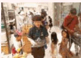
様々な世代のお客様と会話を楽しみながら店頭で試食販売を行っています。

ドンクは「職場を通じて自分自身も豊かな生活を目指す」という経営信条を謳っています。そのためには、いきいきと働ける職場環境づくりが欠かせません。