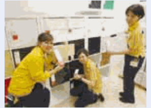
Sales Department 新入社員のコワーカーには先輩がマンツーマンで研修を実施。一人前になるまでサポートします。

役職に関係なく、自分の考えを発信し実現することができる環境の下で、すべてのコワーカーが会社の成長のみならず、個々の成長を目標にいきいきと仕事をしています。