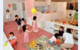
グループ企業で働く人たちの子を預かる託児所。海に面した部屋には明るい陽光が差し込みます。

神戸新聞社は、法定を超える休暇制度や託児所を設けることで、出産・育児、家族の介護など人生のさまざまなステージで安心して働ける職場づくりを目指しています。