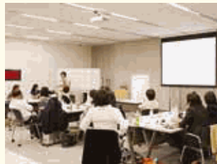
ダイバーシティ促進活動として多様な文化や人材、働き方について講演等を行いました。

企業理念(リリーバリュー)とビジネス戦略の両方の観点から、ダイバーシティの促進や多様な人材を活かした組織の構築に取り組んでいます。