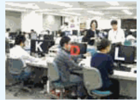
社員数は160名を超えました。平均年齢は35歳と若い会社です。

社員のワーク・ライフ・バランスをサポートする制度を充実させ、その利用も進んでいます。2017年3月「くろみんマーク」(3回目)取得。また、快適な職場環境を構築する取り組みも推進しています。