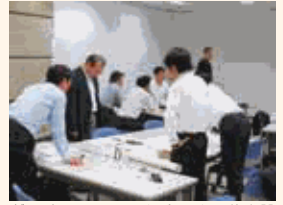
ダイバーシティ・マネジメント研修を開催し、部下の個性を活かしたマネジメントのあり方について話し合いました。

2013年4月にダイバーシティ推進室を新設し、女性活躍推進・働き方改革・男性の育児支援・シニア活躍支援・介護両立支援など、従業員の働きやすい職場環境づくりに取り組んでいます。