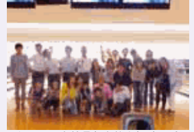
4か月に一度社員と家族を招待しボーリング懇親会

仕事と生活の両立支援制度の充実を目指し短時間制度、半日休暇、フレックスタイム等があり、育児休暇制度は3年間までを設け、働く環境と働き方の改善の為にコミュニケーションも大切にしております。