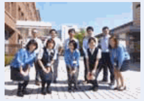
社員一人ひとりの「仕事と家庭の調和」を大切にする職場です

三菱重工グループは、21 世紀のグローバル企業として女性の活躍と更なる多様性の尊重をテーマに、柔軟な働き方やキャリアアップの仕組みづくりに取り組んでいます。