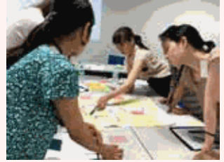
選抜女性を対象にキャリアデザインプログラムを実施しています。

フレックス制度や育児短時間勤務制度など、継続的な就業・活躍を支援する様々な制度を導入しています。育児休暇後の復帰率は100%と高く、各種制度も利用しやすい雰囲気です。