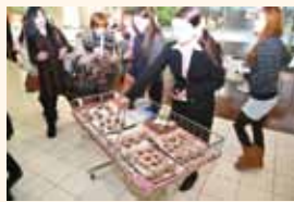
専務自ら店頭でサービスに立ちます。

組合員の皆さまにも、自分たちの「甲南大学生協」と思っていただけの取り組みを進めています。メールマガジン・ホームページ等に組合員が求めている情報を掲載し一緒に生協を作っています。