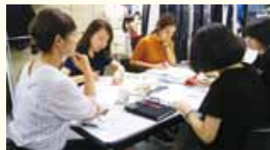
パートタイマーを含む全従業員の女性比率が約8割。女性が働きやすい職場です。

「社員の人生が豊かであればこそ、事業にシナジーが生まれる」との考えに基づき、「1ヵ月休暇制度」や「就業時間選択制度」を取り入れるなどワーク・ライフ・バランスの向上に取り組んでいます。