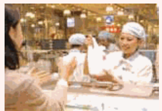
従業員の「健康」は会社の「健康」。いきいき働ける職場づくりを目指しています。

育児、介護、しいてはダブルケア等のライフイベントにより、社員の就労ニーズは更に多様化していきます。今後も多様な就労ニーズに対応できる制度の充実を進めていきます。