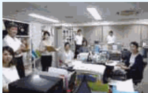
旅行業は数字だけでなく人を見る仕事。 (添乗業務のOJT研修風景)

少子高齢化社会を迎える中、「ワーク・ライフ・バランス」の実現に向け、既定概念にとらわれず、社員一人ひとりが働き方を見つめ直し、将来に向けて新しい働き方を創造し改革していく取り組みを行っています。また、「くるみん」の認定基準に則り将来的に取得を目指しています。