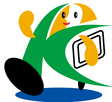
「こうべ男女いきいき事業所」 シンボルマーク