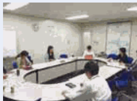
定期的に「職場会」を開催し、職場内の諸問題の解決に努めています。

弊社では保険を通じてお客様にお届けする「あんしん」の品質を向上させるために、社員が絶え間なく成長し続ける企業風土を醸成し、「日本で一番「人」が育つ会社」の実現を目指しています。