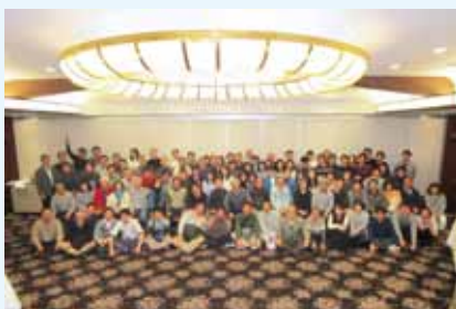
社社会旅行での集合写真です。

川崎重工のグループ企業として、創業60年以上の歴史を有している会社です。職場の親睦を図るために「社社会」があり、夏季の納涼祭や日帰り旅行を開催しています。設立5周年には一泊旅行、10周年にはユニバーサルスタジオジャパンで社員と社員の家族同伴でパーティーを開催しました。