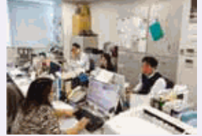
男女に関わらず、担当ごとにお客様のご旅行手配を承っています。

今後も引き続き、男女が平等に仕事もプライベートも充実できる職場環境を目指していきます。