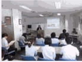
外部専門家を講師に迎えてワーク・ライフ・バランスの研修会を実施

出産や育児、介護などの生活環境の変化に対応できるように柔軟な雇用形態や休暇の取得、復職に関する社内規定を整備し、男女ともに働きやすい職場環境を提供しています。