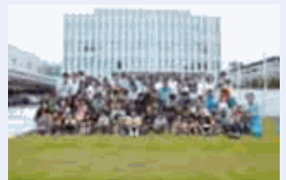
子ども参観日には毎年多くの方が参加されます。

従業員の意識を高め健康増進を図る取り組みのほかに、育児や介護を必要とする従業員の支援制度を充実させることでワーク・ライフ・バランスの向上をめざしています。