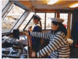
女性船長、乗組員。笑顔の向こうに船長としての目が光ります。

クルーズ船「ファンタジー号」では、船長、機関長等船員に女性を登用し、女性ならではの心配りを活かし、お客様が満足していただけるサービスの提供を目指しています。