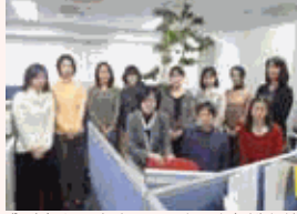
公私ともに充実し、いきいきと働き続けられる環境づくりに努めています。

その為には社員が提案しやすい雰囲気づくりが必要だと感じ、コミュニケーション強化に取り組んでいます。