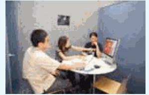
女性目線の考え方が反映されて、より精度の高い提案になります。

私たちの会社は小規模事業所だからこそ、柔軟な動きが取れるというメリットをどのようにして活かしていくかという点に重点をおいています。