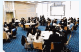
女性の活躍推進やワーク・ライフ・バランス向上のためのセミナーの様子

「社員一人ひとりの能力の最大限の発揮こそが会社発展の原動力である」という理念のもと、社員同士が協力し合う企業文化の醸成と男女共にいきいきと働き続ける職場づくりに進めています。