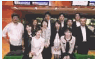
会議後、有志によるボーリング大会。社員が率先して対話の場を設ける。