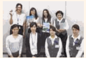
活気あふれる職場です!

女性のキャリア開発支援をはじめ、育休者の職場復帰サポート等の制度も活用しながら、いきいきと働き続けられる職場づくりに取り組んでいます。