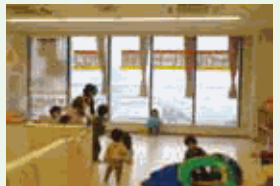
園児たちと楽しくいきいき活動しています。保育士も元氣、園児たちも元氣がモットーです。

パートから正社員に転換し、さらに園長に抜擢した実績があるほか、出産、育児で退職した従業員を再雇用する仕組みがあるなど、多様な働き方の取り組みをしています。ベビーシッター利用補助も実施し、規定の有給休暇以外にパーステイ有給休暇を全員に付与しています。