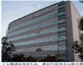
人と環境を守るため、確かな技術力と商品開発力で豊かな未来社会を実現します。

育児休業は子どもが満3歳に達するまで、育児のための短時間勤務制度等は小学校卒業まで、介護休業は最長3年間利用可能です。平成21年にくるみん取得後も、多様な働き方を推進する取り組みを通じて、従業員が働きやすい職場づくりに努めています。