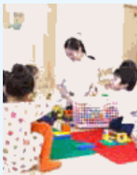
企業主導型保育園「ニチキッズ」と提携、安心して仕事ができます。