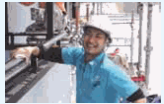
塗装技能士など専門資格の取得にも積極的に取り組んでいます。