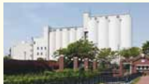
古き良き伝統は守りつつ、新しいことにチャレンジしていくことが、大事であると考えております。

今後も、ワーク・ライフ・バランスを大切にしながら全社員が活躍できる環境づくりを進めていきたいと考えております。