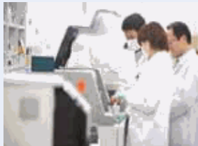
1つの製品を作るために、様々な分野の技術者が力をあわせて研究開発を行っています。

育児・介護等に応じた休暇・福利厚生制度充実。在宅勤務制度導入。社内託児所設置。女性のキャリア形成支援の対話活動等を実施。2016年「えるぼし」【3段階目】を取得。