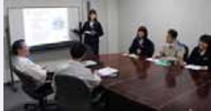
「女性活躍推進プログラム@神戸」に参加した女性社員が、成果発表を行いました。

当社は、男女がともに働きやすい職場づくりへのユニークな取り組みとして、子どもの学校行事への参加、病院への付き添い、介護等に利用できる有給休暇「お星さま休暇」があり多くの社員が取得しています。