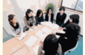
女性だけの勉強会は、内勤の皆さんが気持ちよく働ける事をテーマに議論しています。

社員がいきいきと働いていることは経営者としての幸せです。その為にも、より深みを持ってこれからの未来の社員の為にも頑張っていきたいと思ひております。