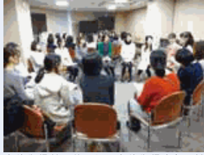
育休復帰前研修では、育休復帰者との情報交換会を実施しています。

当行では、従来より支店業務課の課長を始め、様々な分野で女性が活躍する場を積極的に広げてまいりました。引き続き、男女問わず一人ひとりが能力を発揮し、いきいきと働き活躍できる職場環境の整備に取り組んでまいります。