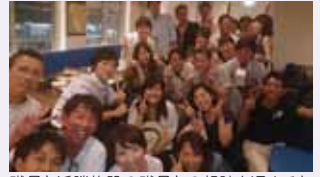
職員と近隣施設の職員との親睦を深めるために開催された合コンイベント

いち早く働きやすい病院評価の認定を取得し、ワーク・ライフ・バランスの実現に向けて取り組んでいます。地域活性化定住に向け合コンイベントを実施したり、ピラティス教室を開催したりしています。