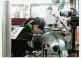
設計・製造部門で働く女性も増えています。

「女性活躍支援と制度の充実に加え、男性でも育児・介護制度が使いやすくなるように制度周知と啓発活動を進めています。また、ホワイトカラーの職場において、効率よく働くことで無駄な残業を減らし、全従業員がワーク・ライフ・バランス（WLB）を実現できるよう働き方改革を進めています。」