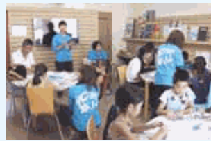
子どもの声「図工が苦手やったけど、今日の仕事で図工が好きになりました」

地域貢献の一環としても、事業所の一部を一般開放し、子ども向けのイベントを通して交流を図っています。