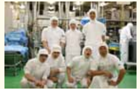
製造現場はいつも笑顔が絶えず、活気に溢れています!

短時間勤務制度など男女ともに働きやすい環境となるよう、柔軟に対応を行っています。また、休暇制度の充実や社内研修などの実施により、全社員がやりがいを感じられる取り組みを今後も進めていきたいと思ひます。