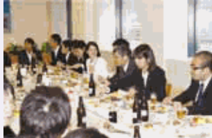
風通しの良い組織を目指し、従業員と役員の懇親会を実施しています。(写真は新入社員と役員)

社員の充実した人生や会社の成長、そして社会全体の発展に寄与すると考え、女性に限らず全ての社員が最大限の力を発揮できるように諸制度のさらなる充実と効果的な運用など、今後も働く環境整備に努めていきます。