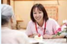
有料老人ホームでは、介護職や看護職を中心に多くの女性が活躍しています。