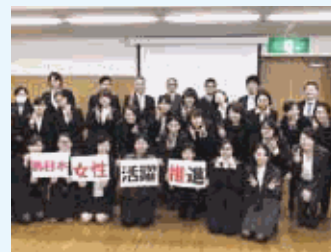
西日本営業部のダイバーシティチーム集合写真

当社はダイバーシティ全社共通方針として「ダイバーシティで、ヨロコビを。」を掲げ、ダイバーシティを通じ、活躍したいと願う従業員がスムーズに働ける環境・仕組み・きっかけを生み出すことで、お客さまへ新たな価値を届ける活動を積極的に推進しています。特に女性ならではの視点とセンスを活かすべく女性の活躍を推進しています。