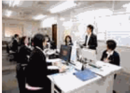
誰もが長く働ける職場づくりに努め、多様なライフサイクルの中で能力を発揮し続けて欲しいと願っています。

当社はパートさんを含めた全従業員を対象に、年一回の経営計画発表会の席上で、優秀社員、優秀事業所を表彰しています。ラフトは「企業は人なり」と考えています。