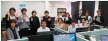
「わくわく 愉しく」「一歩先行く製品創り」がモットーです。

小さな会社だからこそ、人は財産であり、一人ひとりが大切な人財です。個人の事情を認め、お互いに支え合いながら、仕事も生活も愉しんでいます。