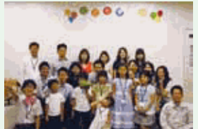
2010年より年1回、子ども参観日を実施しています。