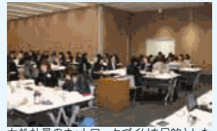
女性社員のネットワークづくりを目的とした交流会を毎年開催しています。

女性の就業継続支援や活躍推進を目的とした各種制度整備や職場風土改革などを進めています。