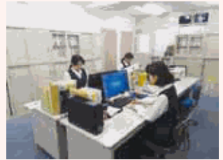
一つの業務を複数の人が対応できるなど、育児との両立を支援しています。

当社では男女を問わず人材の確保や管理職への登用を行っており、今後も優秀な人材を育成し、職場環境をさらに整えていくことで働きやすい職場づくりを目指していきます。