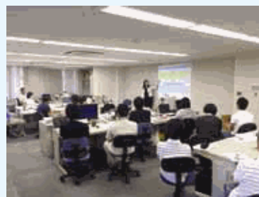
外部講師を招いてワーク・ライフ・バランス研修

弊社では、一人ひとりが自ら考え、活躍できる人材となれるよう、男女を問わず社内外の研修への参加や資格取得を支援しています。また、子育てや介護など社員のライフスタイルの変化に応じて柔軟に制度改革に取り組み、すべての社員がいきいきと働き続けられる職場づくりを目指して活動し続けています。