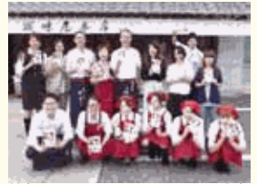
笑顔でのコミュニケーションは、安心安全な食品づくりのベースです。

平成28年4月よりパート社員の正社員登用を積極推進。個々のワーク・ライフ・バランスの充実を図りながら、互いに助け合い、各人の持ち味を活かせる職場環境を目指しています。