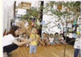
2010年より年1回、子ども参観日を実施しています。

若い人たちが仕事も子育ても両立させていきいきとした日々を送れるよう、コープ自然派ではさらなる制度や福利厚生の充実を考えています。働く人を応援します。