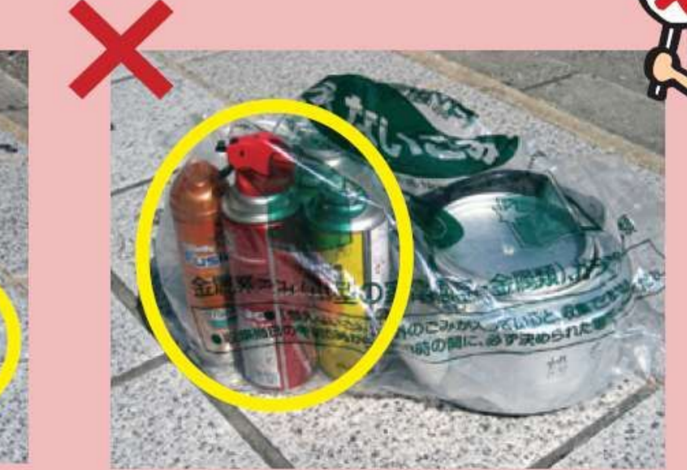
Để lẫn lộn bình xịt, bình gas mini.