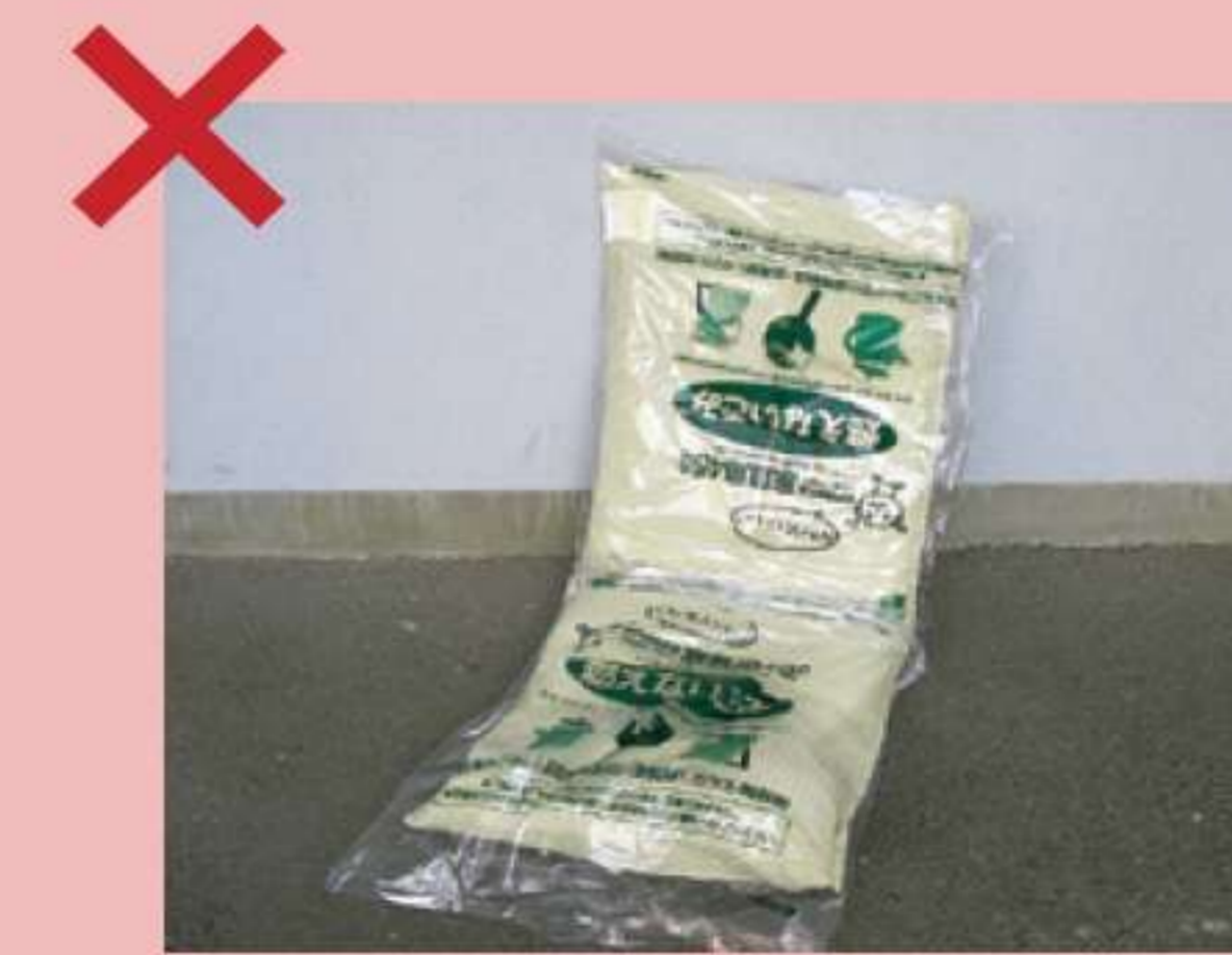
Sử dụng 2 túi để đựng đồ không vừa loại túi quy định.