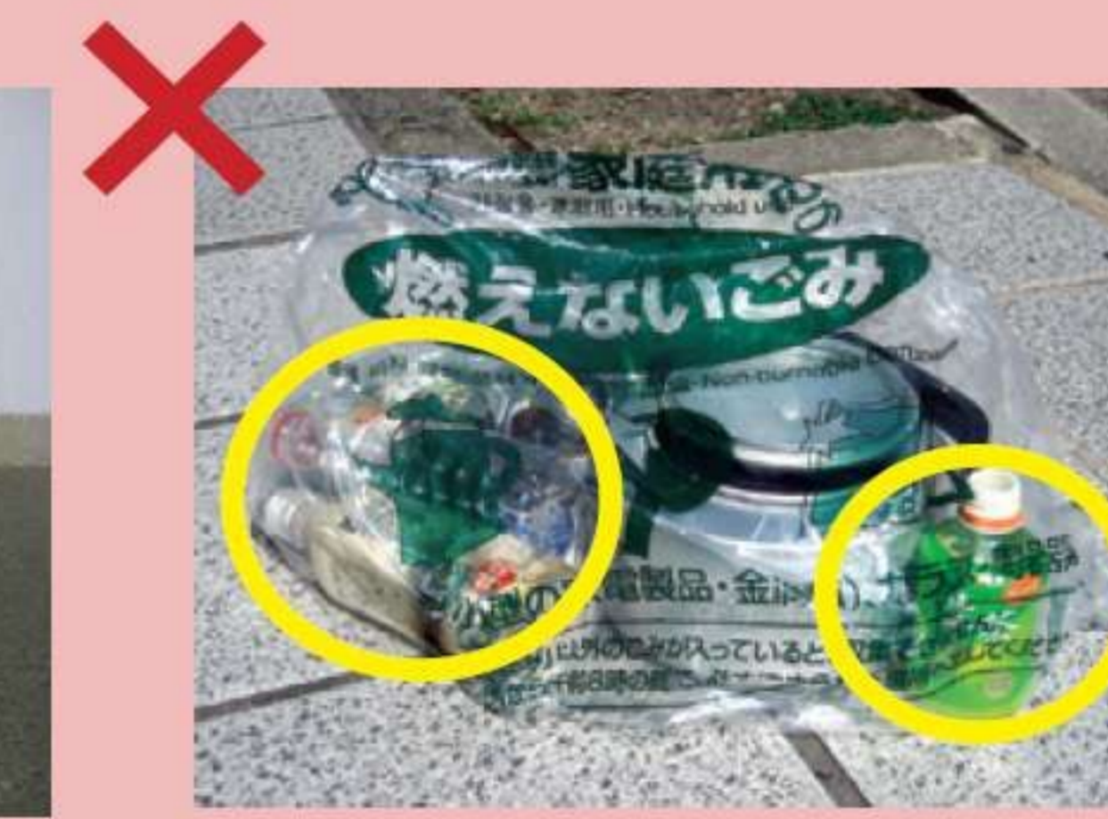
Để lẫn lộn lon, chai, chai nhựa PET đựng đồ uống