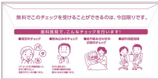
令和4年度ご案内封筒とチラシ