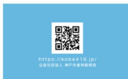
オーラルフレイル啓発カード