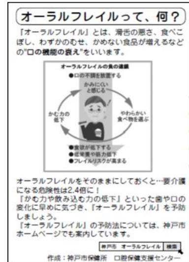
国民健康保険医療費のお知らせ