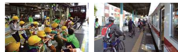
実施日時 2019年10月20日 実施日時 2021年11月3日