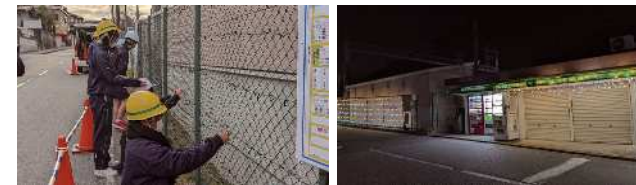
神戸北高生による電飾設置 駅前が明るくなりました

■神戸北高校との協働による駅イルミネーション装飾 (唐櫃台駅/2021年12月20日～26日)