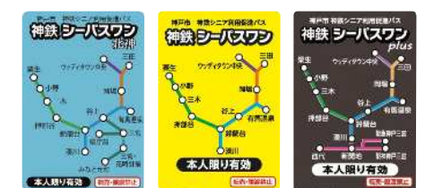
神鉄シーパスイオン北神 神鉄シーパスイオン 神鉄シーパスイオンplus