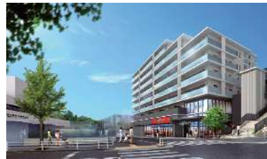
アトラス神戸北鈴蘭台 概要 用途:店舗(コープこうべ)、共同住宅 階数:地上10階建、地下1階

2020年から工事が始まった駅前の再開発。いよいよ本年5月、商住一体型ビル(アトラス神戸北鈴蘭台)が完成します。並行して駅西側の駅前広場も便利で使いやすく変わりました。