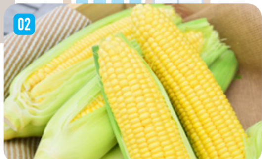
6月下旬から8月上旬が食べごろです！

神戸市の施策や地域の豆知識を神戸弁の「うわさ」形式で広めるKOBÉうわさプロジェクトをご存知でしょうか。神戸電鉄や地下鉄、庁舎や病院などで、吹き出しの形をしたいろんなうわさを目にいただいていると思います。その中から北区にまつわるうわさについて一部をご紹介します。このうわさ、一度確かめてみませんか。