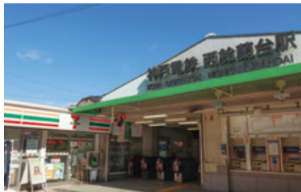
▲現在の西鈴蘭台駅前