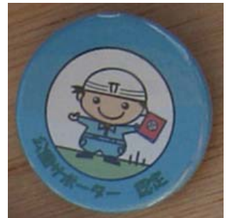
公園サポーター 認定バッチ