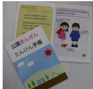
公園あんぜん たんけん手帳