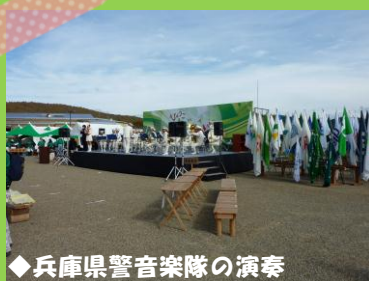
◆兵庫県警音楽隊の演奏