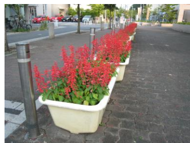
長田区役所のサルビア

今回ご紹介するのは「長田区の花サルビア」です。区の花としては最も早く、昭和60年1月に選定されました。鉢植えや花壇など狭いところで手軽に植えられ、開花時期が長いことが選ばれた理由のようです。サルビアは7月～10月頃にかけて、紅、紫、桃、白色の花を咲かせます。花言葉は「燃ゆる想い」です。