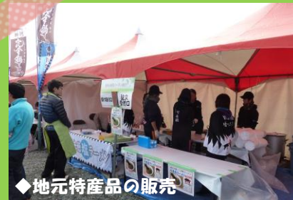
◆地元特産品の販売