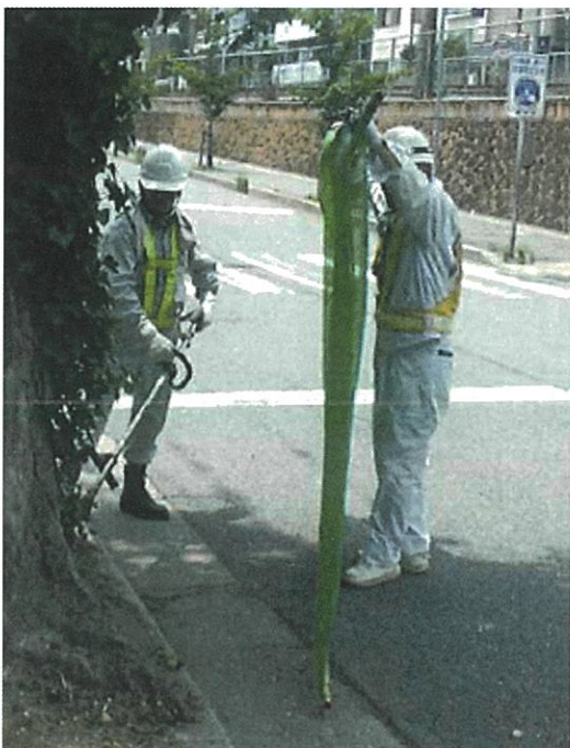
防護ネットの設置位置

※草刈機の刃の回転方向特に石が飛びやすいので草を刈っている方の左側は特に気をつけてください。