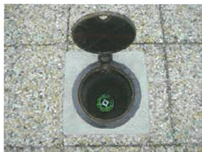
これが止水栓です

蛇口が壊れて水漏れしている～!そんな場合、とりあえず水漏れを止めていただくと大変助かります。近くに止水栓がある水飲台であれば止水栓をパカッと明けると(ドライバーなどを穴に差し込み持ち上げれば開けられます)