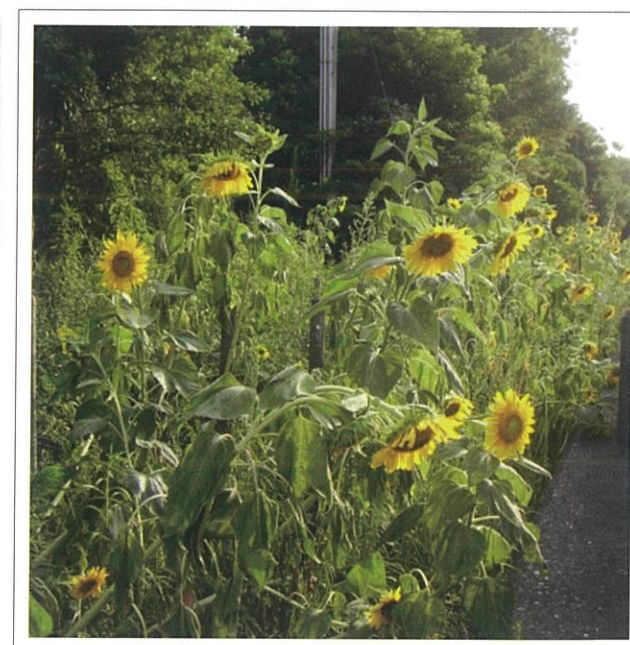
「花の街道」平磯緑地の垂水ひまわり街道

今回の特集の他、あなたの公園で何かお気づきの点がありましたら お近くの建設事務所公園緑地係までご連絡ください。