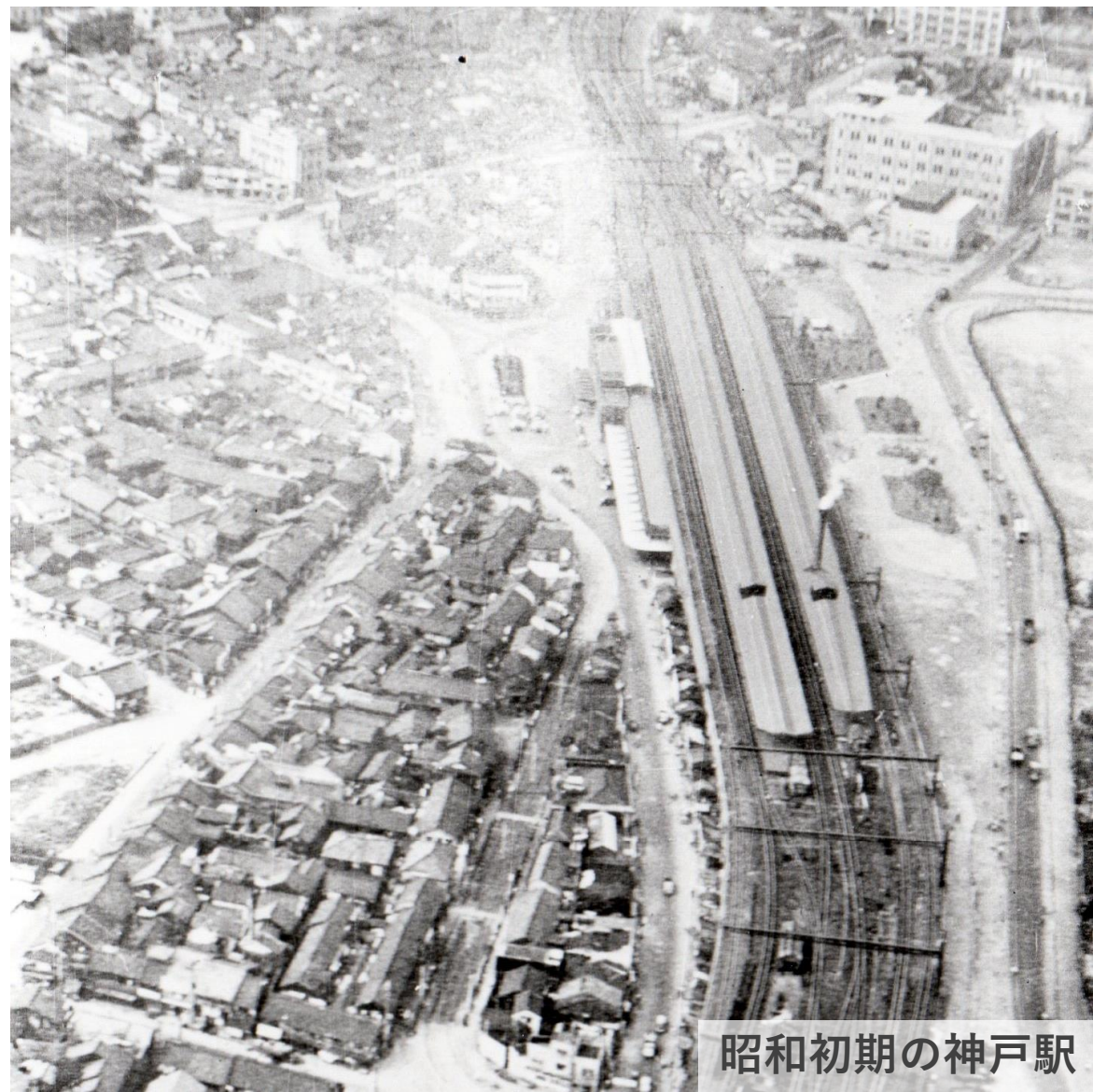
昭和初期の神戸駅