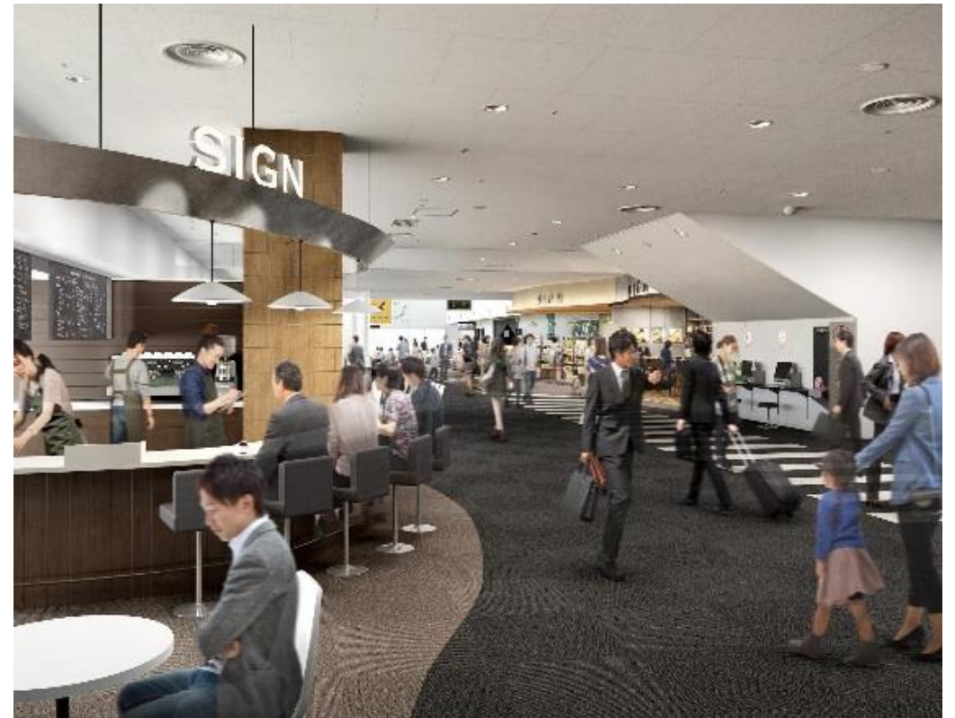
2F 搭乗待合室（改修のイメージ）