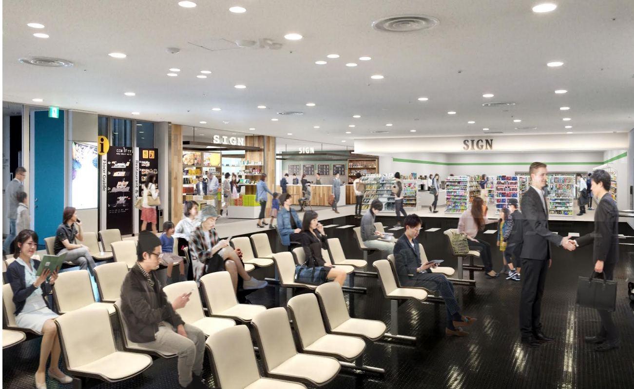
1F 到着ロビー（改修のイメージ）