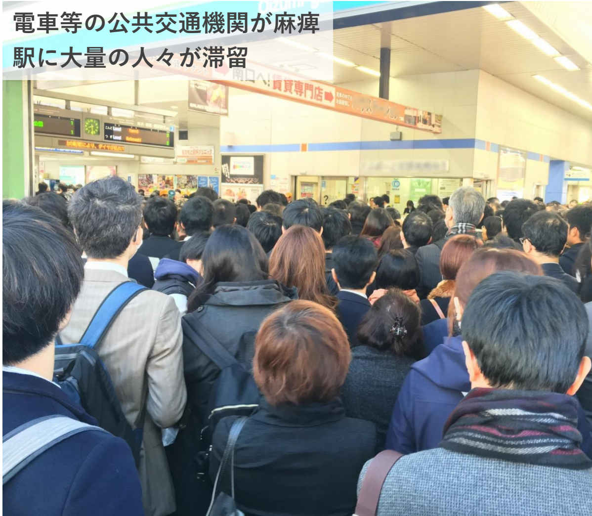
電車等の公共交通機関が麻痺 駅に大量の人々が滞留