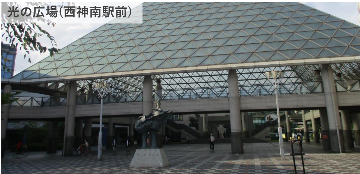
光の広場(西神南駅前)