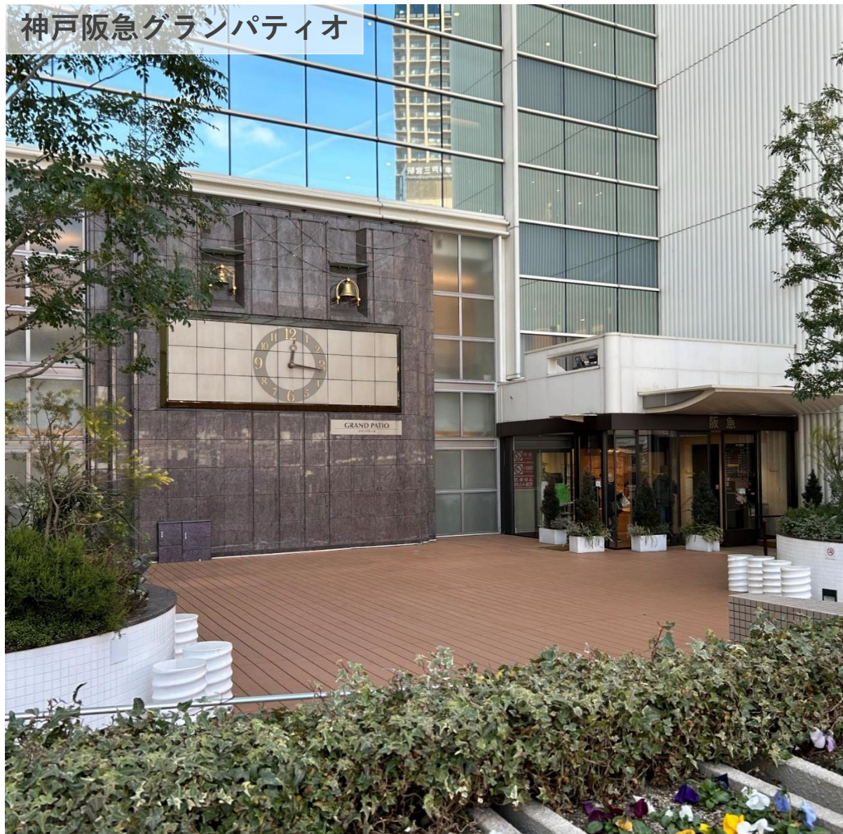
神戸阪急グランパティオ