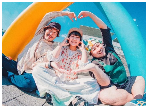
登録アーティスト