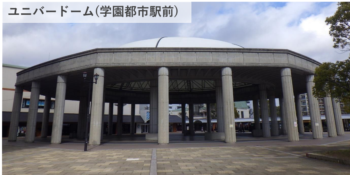
ユニバードーム(学園都市駅前)