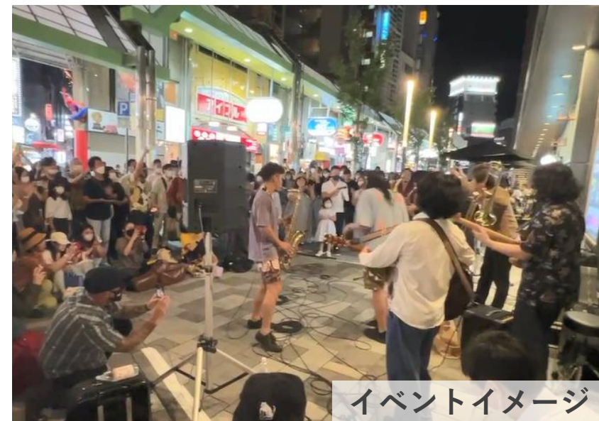
イベントイメージ