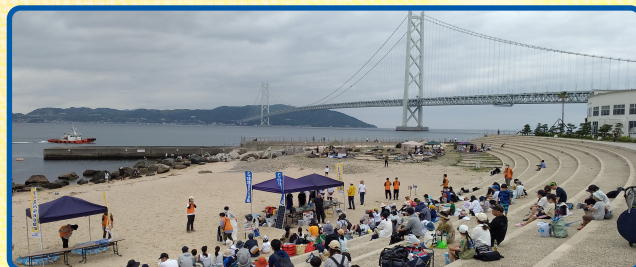
画像: 令和5年度開催時のようす

海辺の様々な生きものと ふれあって観察してみよう! 専門家の先生の解説や、 質問コーナーもあるよ!